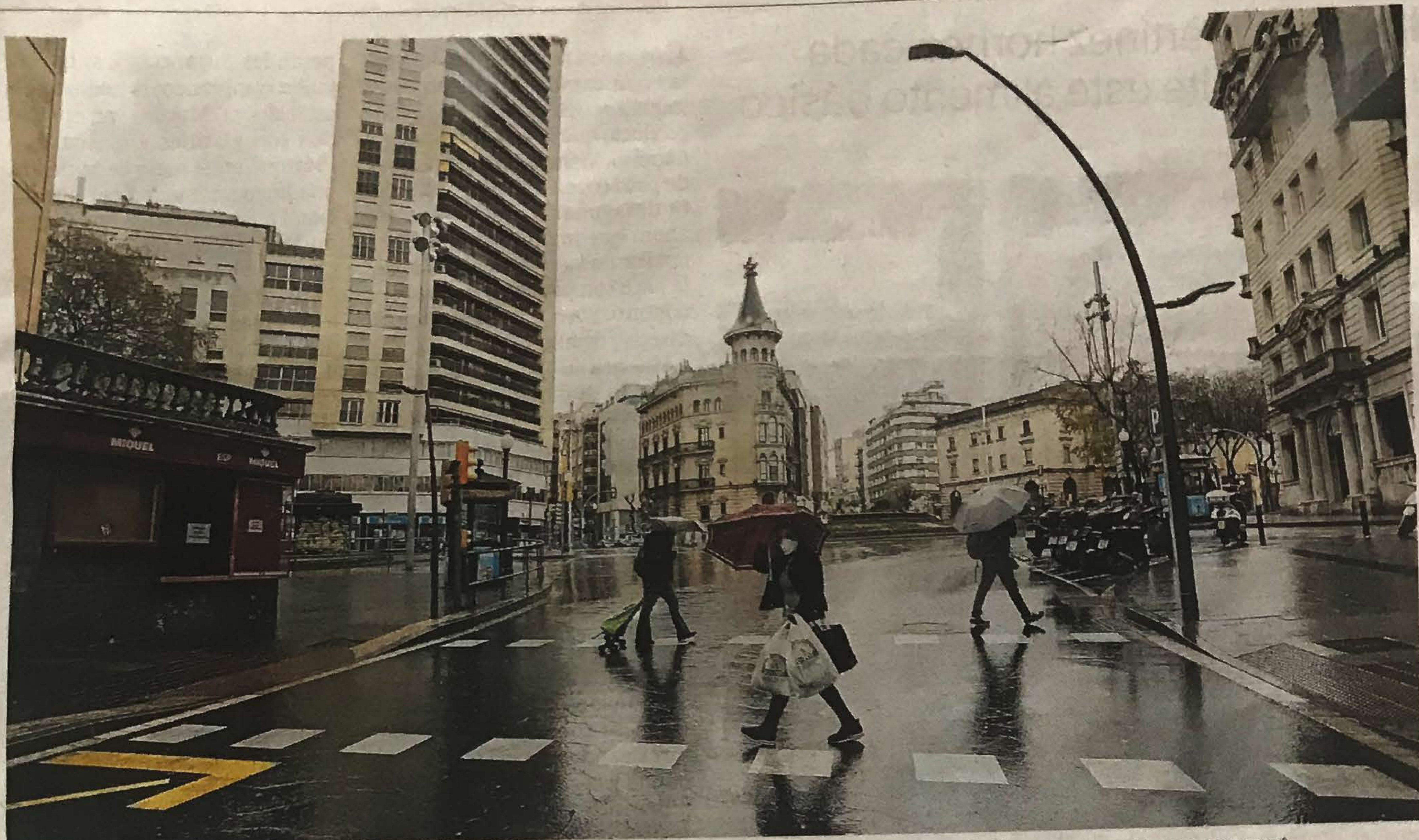
Varias personas cruzan un paso de cebra en Ramón y Cajal, junto a la Rambla Nova, en el centro de Tarragona, ayer.