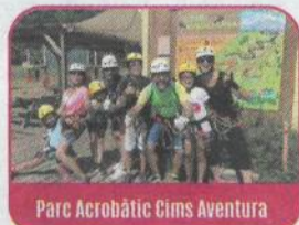
Parc Acrobàtic Cims Aventura

El Parc Acrobàtic Cims Aventura és un espai ideal per a famílies, situat en l'entorn natural del Pallars Sobirà, concretament a l'entrada del municipi de Rialp. Al parc disposen de tres circuits de diferents nivells de dificultat: un infantil de 8 zones, un juvenil de 12 zones i un per a joves/adults de 20 zones. A més d'una tirolina de 100 metres, també podràs gaudir d'una experiència única passant per ponts i xarxes. Qui és el més àgil, ràpid i atrevit de la família? Descobreix-ho al Parc Acrobàtic Cims Aventura! Més info: www.cimsaventura.com