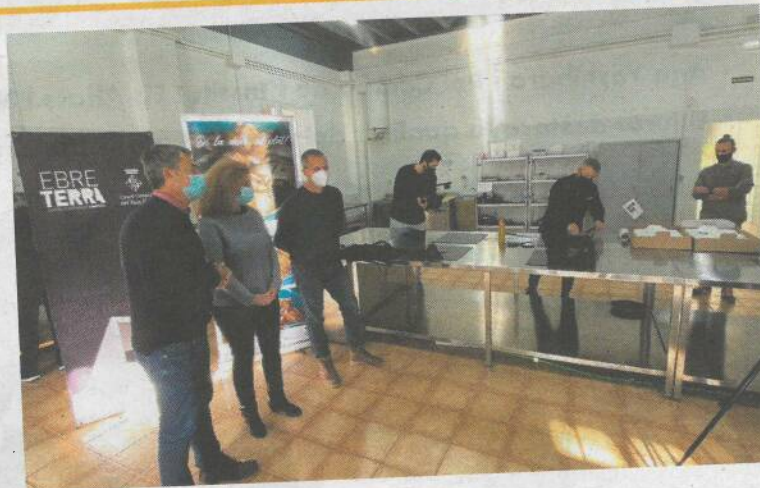
de comunicació del territori. "Accions que difonguin el valor del producte de la mar de l'Ebre, ajuden al sector pesquer i també altres com el turisme de la restauració".