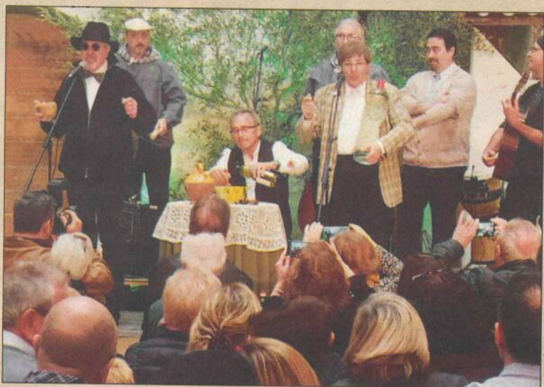
Els Quicos van estrenar l'espectacle 'Pregunteeu-li a l'olivera' en un dels espais de l'antic edifici de la Immaculada.