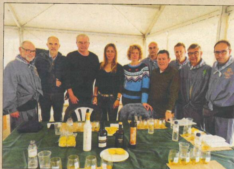
Membres de la comissió organitzadora amb el Jurat Gastronòmic. També es van decantar pel Montsagre d'Horta com el millor oli de la fira.