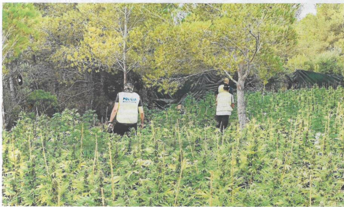
Plantació de marihuana, a la partida del Suís del Perelló.

Els Mossos han detingut en els dos operatius deu persones, tres de les quals han ingressat a presó després de passar a disposició judicial