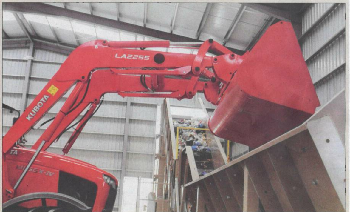
Imatge de les instal·lacions a la nova planta de transferència de l'Aldea, en període de proves.