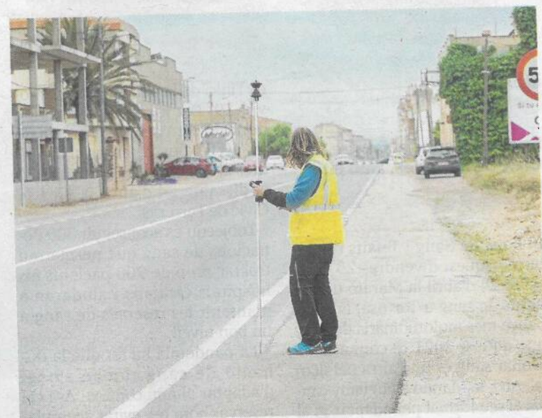
Aquesta setmana han iniciat els treballs els topògrafs.

El col·lectiu també ha recorregut, per impugnar-la, la junta de govern local extraordinària de l'Ajuntament de Tortosa que va donar la llicència d'obres el 24 de febrer. Fonts del consistori han apuntat que els serveis jurídics estudien el recurs, però neguen que s'atorgués sense «quòrum» suficient o sense justificar el caràcter extraordinari de la junta, i defensen que la llicència s'ha aprovat «correctament».