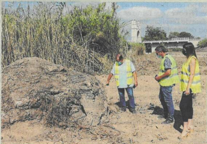
El niu de metralladora trobat.

Un agent dels Mossos d'Esquadra, que es trobava fora de servei, va detenir a Tortosa un home de 46 anys, de nacionalitat romanesa i veí de Vilanova i la Geltrú, com a presumpte autor d'un delicte de robatori amb violència. Els fets van ocórrer sobre les 11.30 hores del 31 de juliol, quan l'agent que es trobava comprant a l'interior d'una perfumeria, va observar com un home agafava productes dels expositors i els introduïa a l'interior d'una bossa. Tot seguit l'home va iniciar el camí de sortida de l'establiment i l'agent va interceptar-lo per tal de recriminar-li el que acabava de fer, al mateix temps que s'identificava com a policia. L'home va desatendre les indicacions i va reaccionar violentament. Després d'un forcejament, el policia va poder reduir l'home i detenir-lo mentre arribaven al lloc altres efectius policials. La bossa que portava l'home tenia un folre metàl·lic per poder evitar els sistemes d'alarma. Els productes recuperats de l'interior de la bossa tenien un valor de 890 euros i van ser retornats al comerç.