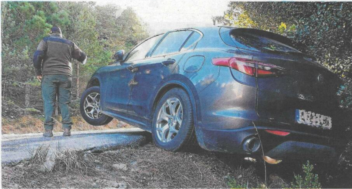
Cotxe sortit de la via pel gel a la carretera de Caro.