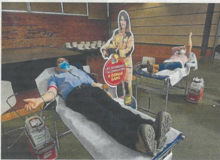
La jornada de donació de sang va tenir lloc a l'auditori d'Amposta.

L'Auditori Municipal d'Amposta va acollir ahir la setena edició de la jornada de donació de sang que organitzen el Banc de Sang i Teixits amb la col·laboració dels Bombers a la ciutat. Però en aquesta edició de la campanya 'Els bombers t'acompanyen a donar sang', a causa de la Covid, no hi van poder ser presencialment, però sí amb una figura impresa a mida real. Les donacions de sang es van dur a terme amb cita prèvia. Precisament els bombers d'Amposta són els protagonistes del cartell de la campanya d'enguany a tot Catalunya, amb una foto al Pont Penjant.