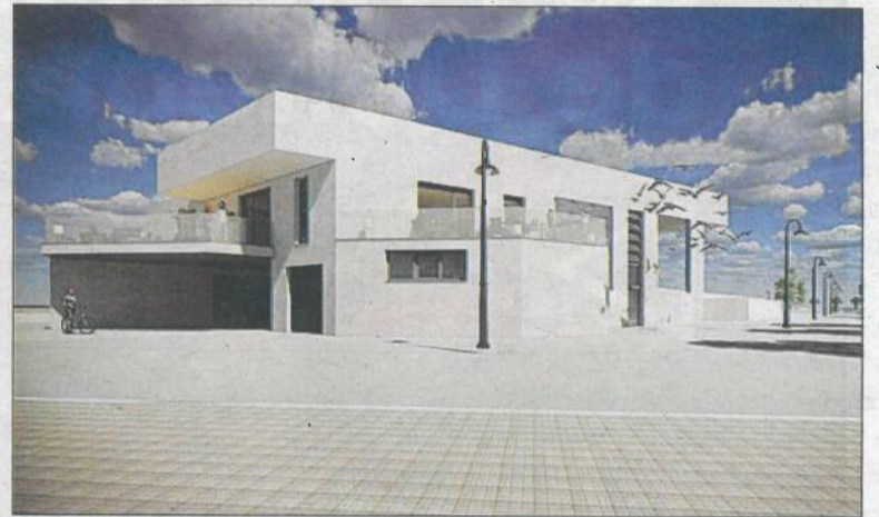
Imatge virtual de la futura llotja de peix de Deltebre.