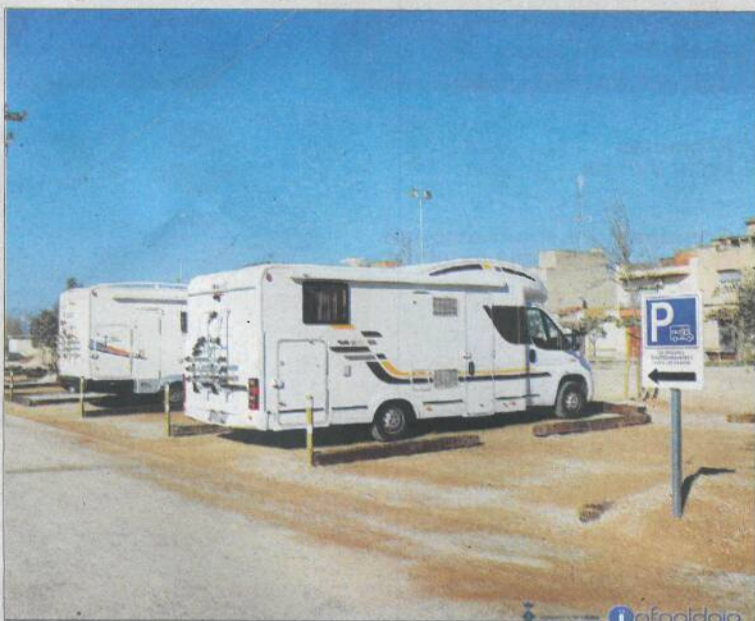
Imatge de la nova àrea per a caravanes.

L'ALDEA L'Ajuntament de l'Aldea ha posat en servei una àrea d'autocaravanes i vehicles càmpers que ja estarà operativa durant els propers dies de Setmana Santa. L'àrea disposa de 12 places, servei d'aigua, servei d'abocament d'aigües grises i negres i enllumenat i es troba ubicada al costat del Parc de la Via, darrere del punt d'informació turística del municipi, tocant al nucli urbà i pròxima als comerços, a la xarxa de carril bici i vies verdes i amb un accés directe al Camí de l'Ermida, una de les vies d'accés al delta de l'Ebre, segons ha destacat el govern municipal de Junts Per l'Aldea a través d'un comunicat de premsa. ■