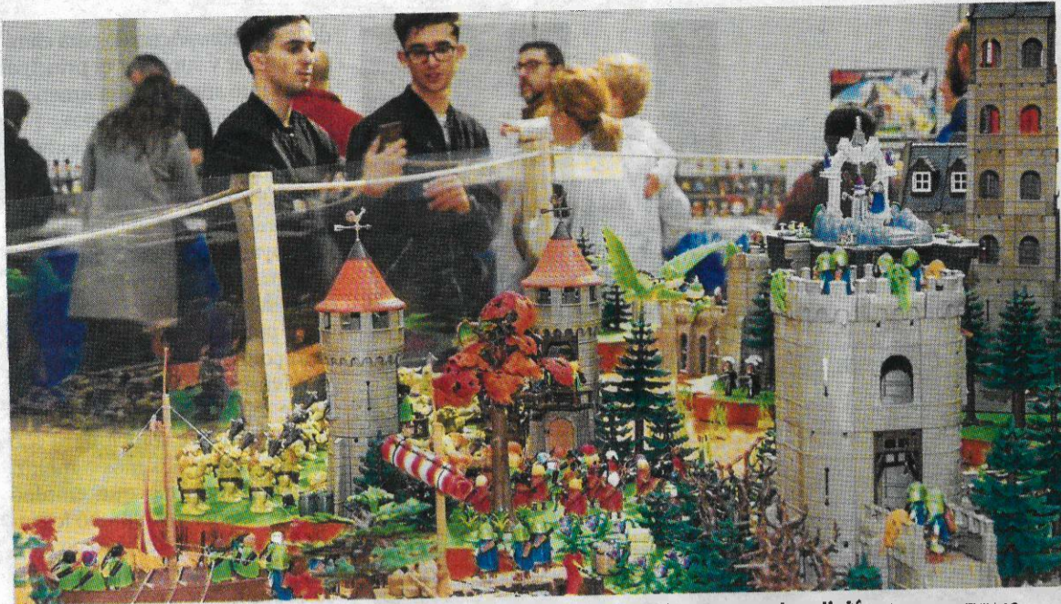
Els organitzadores esperen superar enguany els 6.000 visitants de la passada edició.