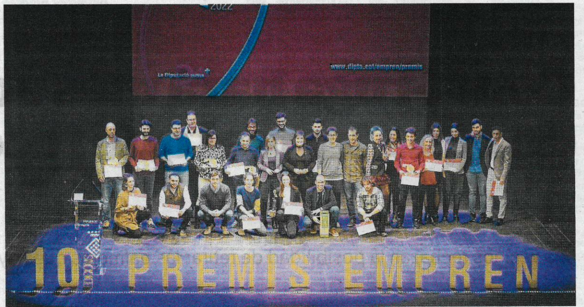
Els guanyadors de la 10a edició dels Premis Emprèn, ahir al Teatre Fortuny de Reus.

Pobla de Mafumet), La Gran Pas (Reus), Activatic, Acadèmies de Reforç i Anglès (Tarragona), Kompy (Altafulla), Muebles Perenne, SL (La Sénia), Nanochonia (Tarragona), La Bastida Participació, SCCL (Santa Coloma de Queralt), The Arbre Team (Santa Coloma de Queralt), Centre de Dinamització Rural La Brostada (Bràfim), Prades Aventura (Prades). Tots ells, s'enduen un premi econòmic de 1.000 €.