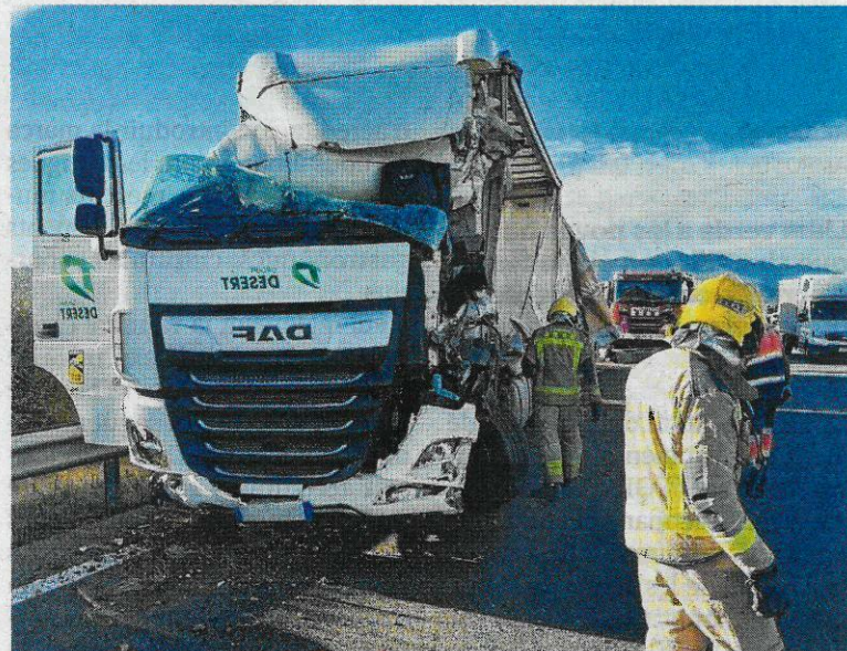
Un dels camions accidentats a l'AP-7 a Uldecona.

El Consell de Seguretat Nuclear (CSN) ha informat favorablement del pla de residus radioactius que preveu emmagatzemar el combustible gastat a les mateixes centrals. El pla ha emès l'informe preceptiu no vinculant, amb un vot particular en contra d'un dels seus consellers. Es tracta del document, que correspon al setè Pla General de Residus Radioactius, sol·licitat pel Ministeri per a la Transició Ecològica i Repte Demogràfic (MITERD). El pla, que haurà d'aprovar el Consell de Ministres, preveu la construcció dels Magatzems Temporals Descentralitzats (ATD) per gestionar els residus i combustibles gastats fins que aquests es puguin traslladar als magatzems definitius, els quals entraran en funcionament l'any 2073.