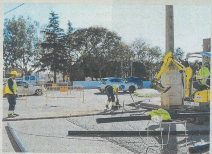
Detall dels treballs al carrer Sant Edmund.

Campredó ha aprovat el pressupost per a l'any 2022. «No són els pressupostos que voldríem per als campredonencs, ja que els millors pressupostos serien els que correspondrien a un municipi legítimament constituït», ha declarat l'equip de govern. Les inversions més destacades són la urbanització del Carrer Solicrú, en la seua primera fase; la dignificació de l'entrada a Font de Quinto pel Canal de l'esquerra; una nova àrea de lleure i passeig del lligallo del Raval del Pom i Font de Quinto; la repavimentació i eixamplament del camí vell de Campredó-Tortosa, tram de Soldevilla, o la construcció de dos pistes de pàdel, entre d'altres.