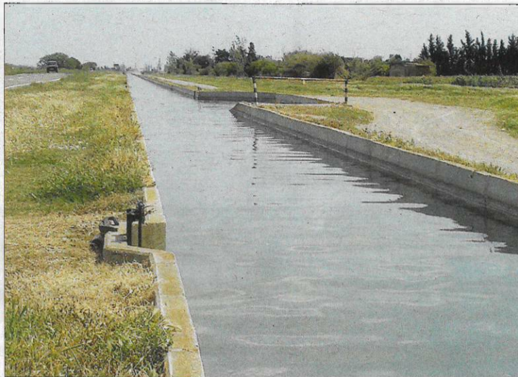
El Canal de l'Esquerra funciona a ple rendiment d'abril a octubre. / L'EBRE

LA GESTIÓ DE L'AIGUA, A DEBAT Esta proposta de la Comunitat de