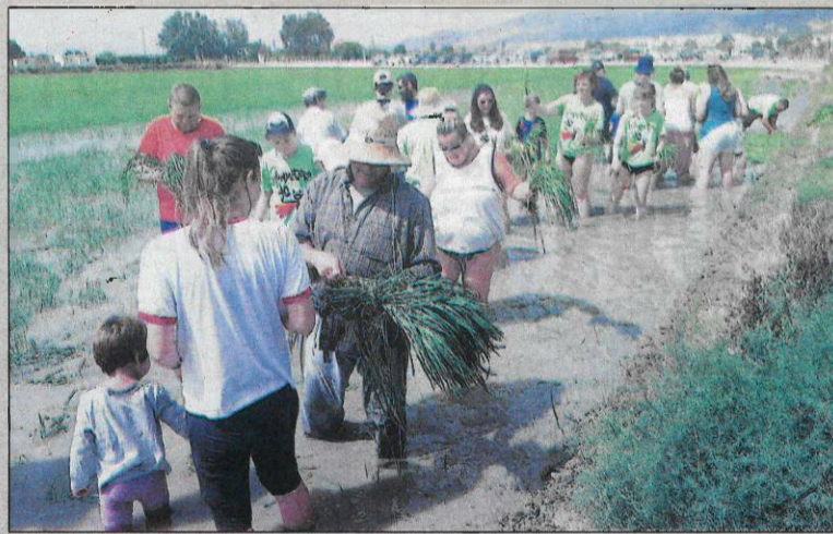
Imatge de la festa de la Plantada del passat cap de setmana a Sant Jaume d'Enveja (a l'esquerra) i a la Ràpita (a la dreta). CEDIDES