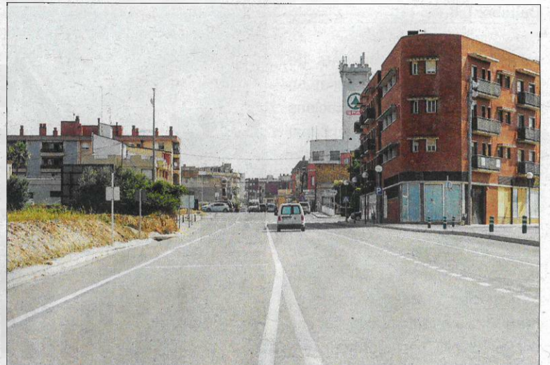
Imatge d'esta setmana del mateix punt. / NÚRIA CARO

tre posar la primera pedra a una renovada avinguda Catalunya, pensada per a la gent del poble, per al comerç i, per extensió, per a rebre visitants. Dos anys després, el mateix