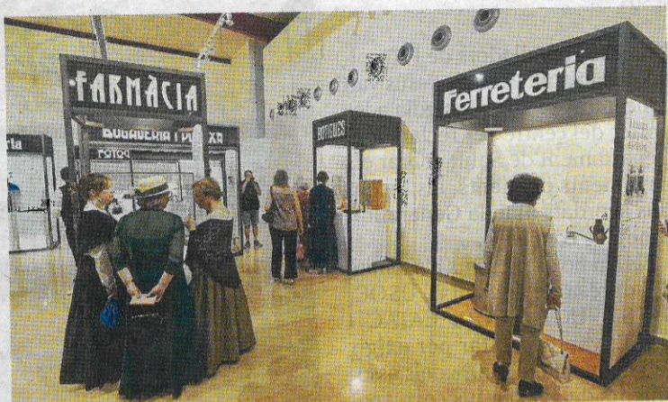
L'exposició al Museu de les Terres de l'Ebre.