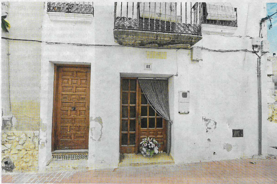
Flors dipositades a l'entrada del domicili de la parella que ha perdut la vida.

Eren de Vilanova i la Geltrú i s'havien mudat al poble feia poc. Van morir per inhalació de diòxid de carboni en usar un grup electrogen