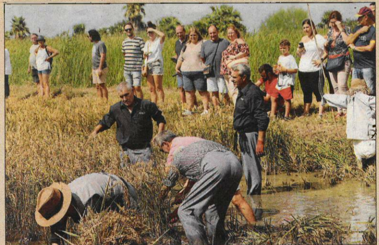
Imatge d'este diumenge de la Festa de la Sega que es va celebrar a la Finca Bombita de Deltebre.

L'ALDEA, DIUMENGE 18 DE SETEMBRE Este diumenge 18 de setembre, a la Finca de Ravanals, arriba la tradicional Festa de la Sega de l'Arròs. La jornada començarà a les 10.30 h amb la sortida dels Segas-