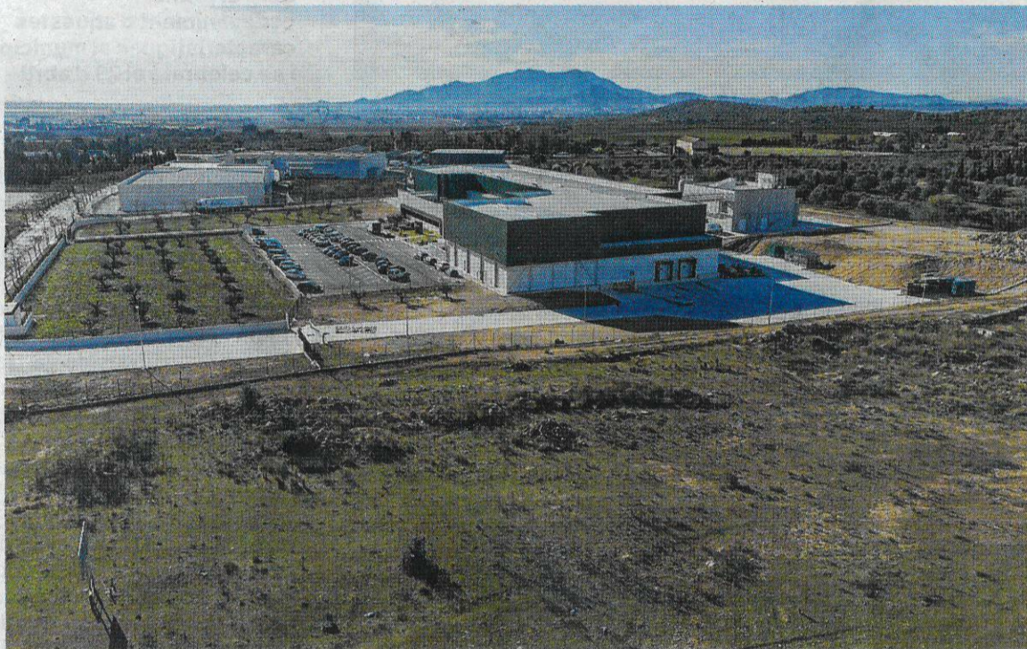
Aquesta és la fàbrica de Florette al polígon Catalunya Sud.

El PDU es va anunciar el passat 30 de març i des de la Generalitat s'ha donat prioritats a la seua tramitació, ja que ha de servir per a ordenar i impulsar aquest sector econòmic com a pol d'atracció industrial no només per a les Terres de l'Ebre. «Està contemplat dins de l'estratègia logística i industrial del conjunt de Catalunya», remarca per la