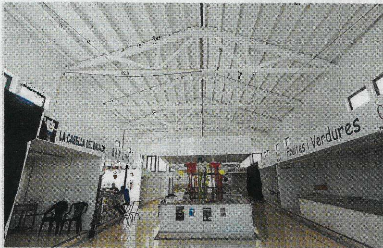
Estat actual de l'interior del mercat municipal de Roquetes.