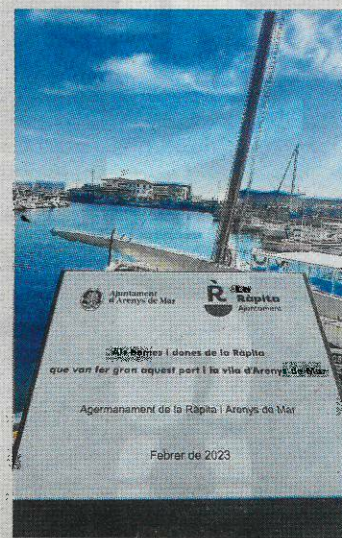
La placa al port d'Arenys de Mar.

La Ràpita i Arenys de Mar van reforçar, el passat cap de setmana, el seu agermanament en una visita al municipi del Maresme. Una quarantena de rapitenques i rapitenques es van desplaçar fins a Arenys amb la finalitat de mantenir vigent