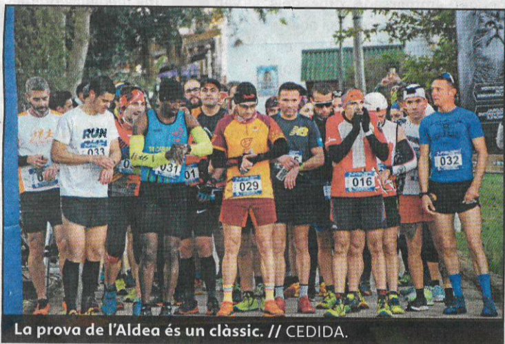
La prova de l'Aldea és un clàssic.