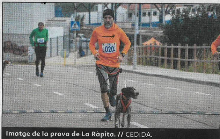
Imatge de la prova de La Ràpita.