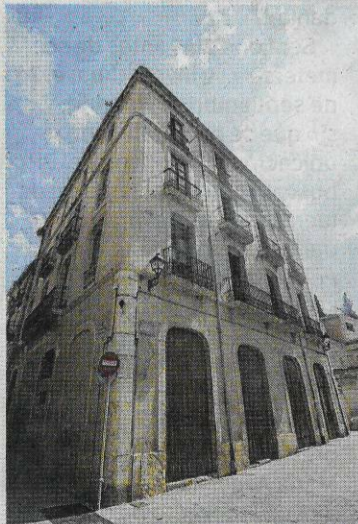
Façana de la casa Henz, a la plaça Mossèn Sol.

Nova ensorrament de part d'un immoble a la part antiga de la ciutat de Tortosa. El passat cap de setmana es va produir l'ensor-