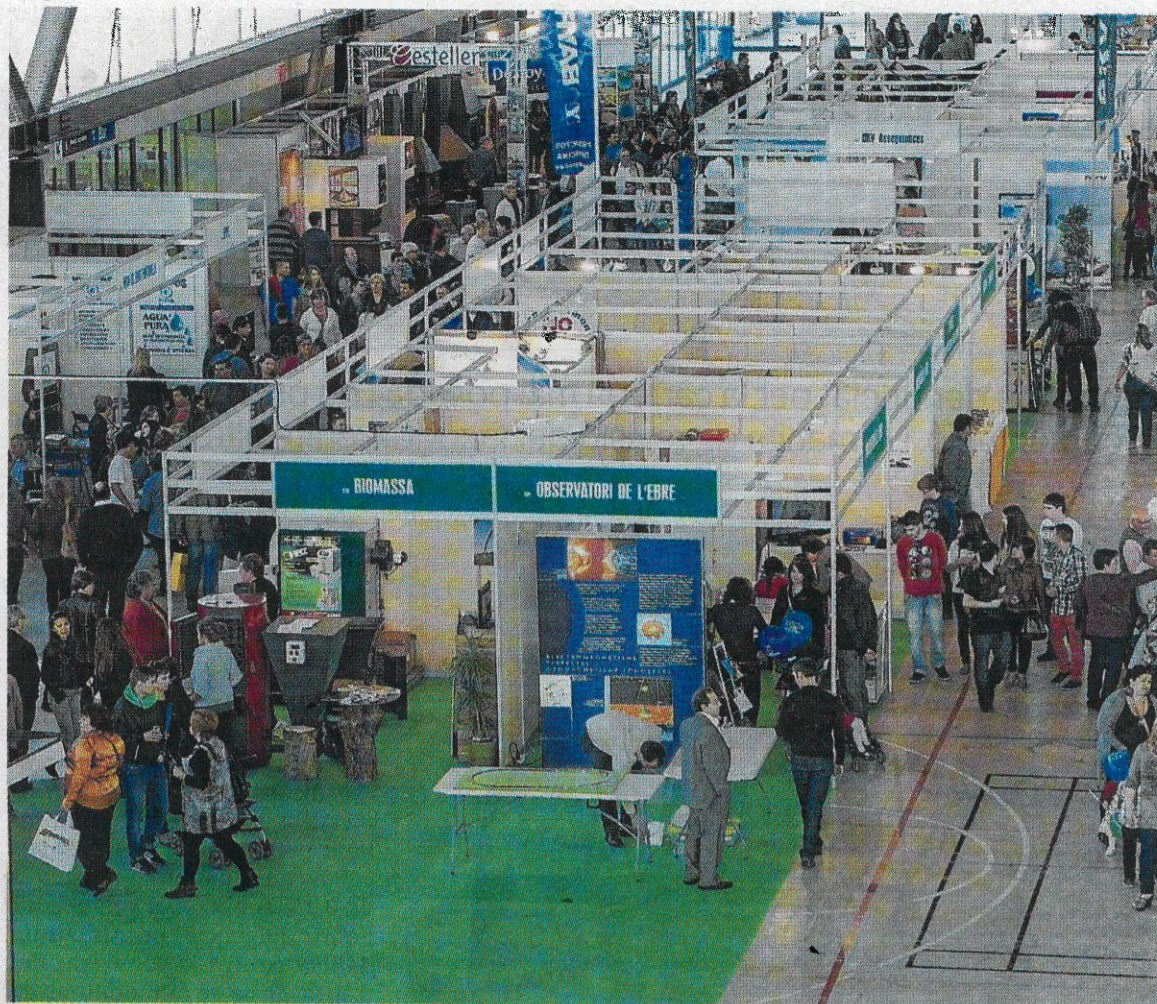
Una anterior edició de la fira Expoebre de Tortosa.

Enguany es reforça l'espai Ebre Ambient, amb una mostra del projecte Life Turbines d'Aigües Tortosa, un projecte per poten-