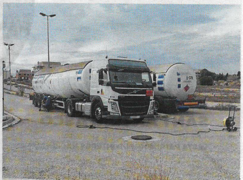
Transvasament del producte a una altra cisterna.

Després de tancar la fuga, el camió va ser acompanyat pels bombers i custodiat per Mossos fins a un polígon proper. Allà es va procedir a transvasar el producte a una altra cisterna.