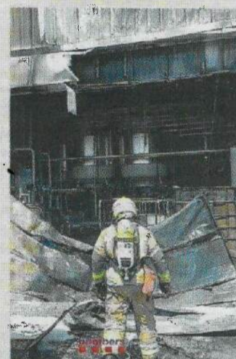
Afectació de l'incendi a la fàbrica.

Ensurt dijous a Camarles per l'incendi en una fàbrica de tubs. Un foc iniciat en uns bidons de resina (producte altament inflamable) va provocar que s'expandís a altres bidons de la mateixa substància. Els Bombers van estimar que s'haurien cremat uns mil litres i això va generar el núvol negre. Fins al lloc, el carrer Deltebre,