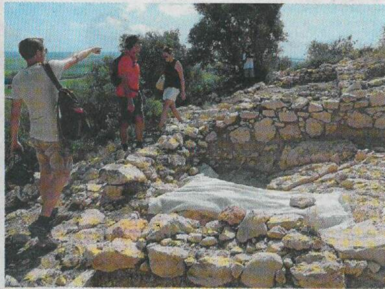
Excavacions al jaciment de l'Antic.

L'altre gran objectiu de la campanya ha estat avançar en el coneixement de la gran estructura murària de més de 40 metres de longitud, documentada l'any passat.