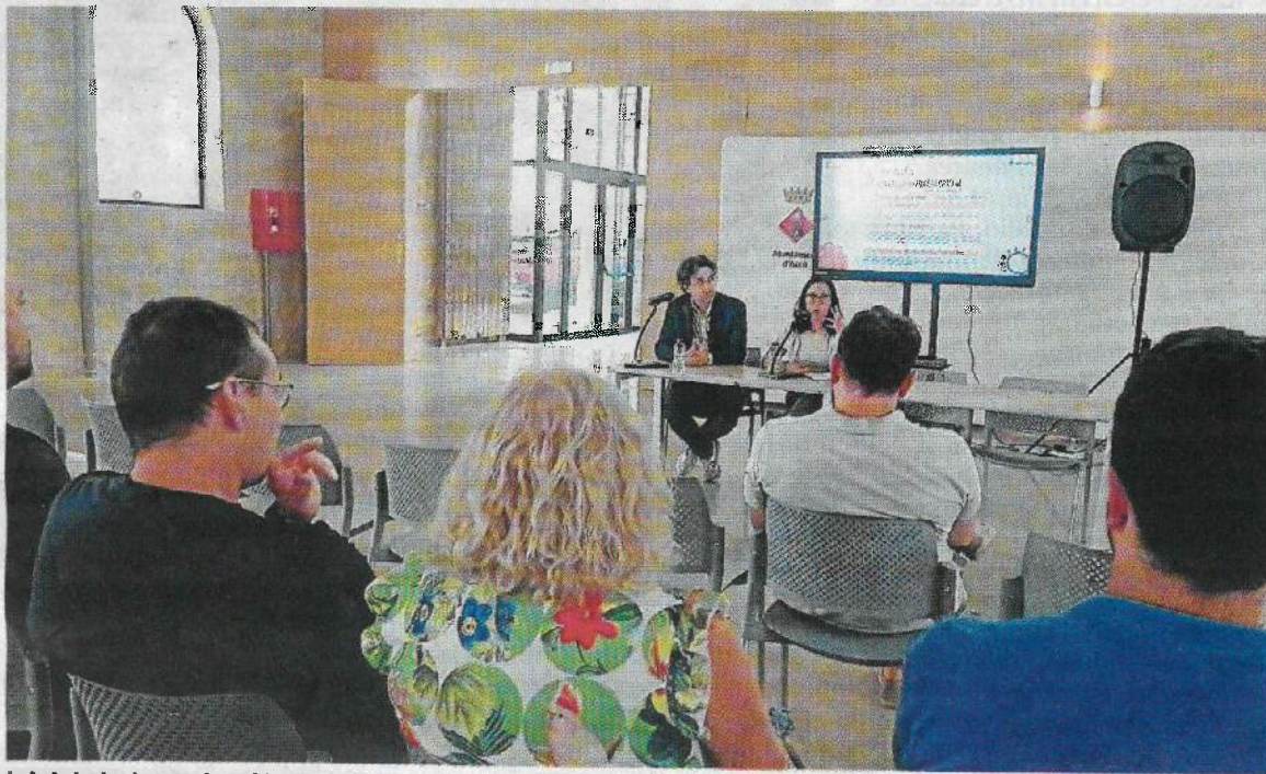
Inici de la Jornada, al Magatzem de Rita d'Ascó.

Un dels reptes al nord de la Ribera d'Ebre és l'emprenedoria i l'autoocupació, en una zona que arran de la seva tradició industrial centenària, amb la planta química de Flix des del segle XIX