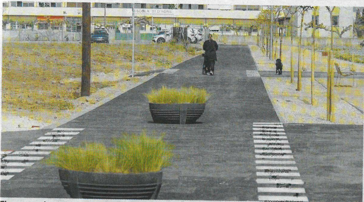
El nou passeig per accedir a l'Escola 21 d'Abril de l'Aldea.