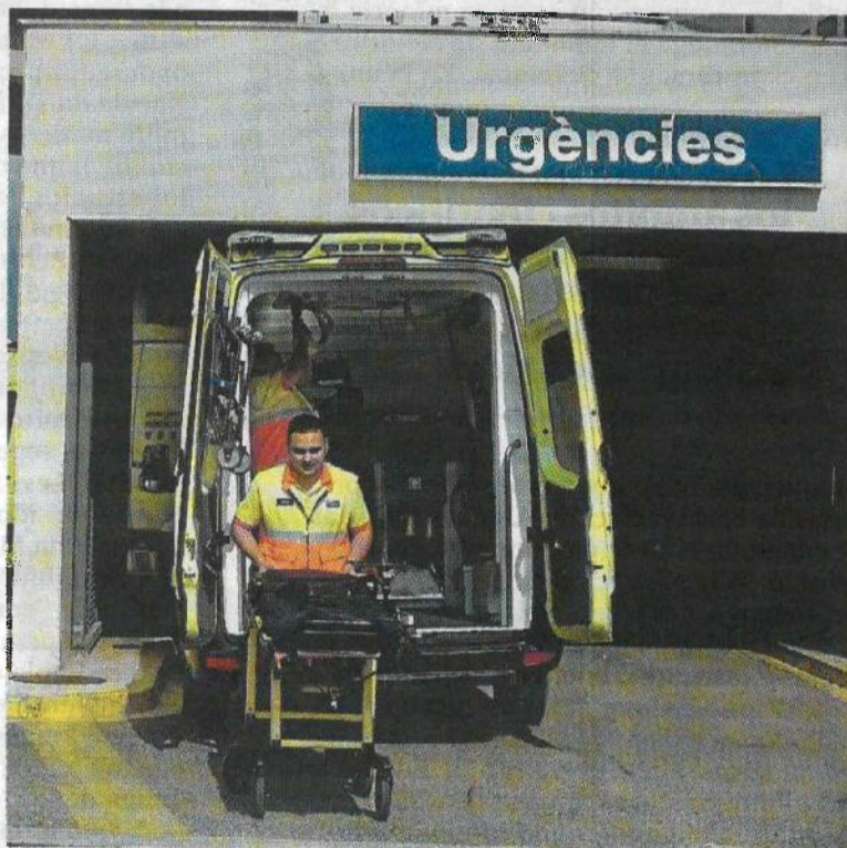
Accés a Urgències de l'Hospital Verge de la Cinta.

En el cas de l'ampliació de l'Hospital Verge de la Cinta, les obres estan aturades des del passat mes de desembre, quan van aparèixer unes restes que correspondrien a unes sitges del segle XVI. Ara s'està acabant de determinar, per part de totes les parts implicades, com s'han de preservar les troballes i com afecta això a l'ampliació del centre sanitari.