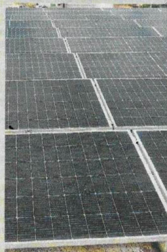
L'objectiu és millorar l'eficiència energètica.

mitjançant la instal·lació d'un sistema fotovoltaic per a l'autoconsum compartit. Els panells solars, situats a la coberta del pavelló poliesportiu, proporcionaran energia a una xarxa diversa d'equipaments municipals. Aquesta iniciativa preveu la instal·lació de 188 panells receptors fotovoltaics amb una potència de 109,04 kWp i una potència nominal inversora de 100 kWn. A banda de cobrir les necessitats energètiques del pavelló, aquesta instal·lació permetrà subministrar energia a altres equipaments del municipi com ara l'Ajuntament, la